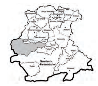
Der Landkreis Garmisch-Partenkirchen mit seinen politischen Gemeinden (= Spielorten)

Die Medien haben diese erste Aufführung im Landkreis intensiv begleitet. Neben der Berichterstattung in der Tageszeitung und einem regionalen Wochenblatt schlug sich das Medien-echo auch auf die Berichterstattung in dem regionalen Radiosender, Radio Oberland, und selbst in der Berichterstattung durch den Evangelischen Presseverband nieder.