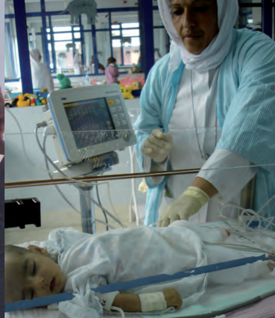
Kinderintensivstation der Klinik.