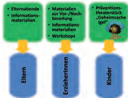
Die einzelnen Elemente des Präventionsprojektes

Nachdem wir uns unsicher waren, ob das Projekt die notwendige Akzeptanz erfährt, wurde entschieden eine Pilotaufführung in der Gemeinde Oberau an den Beginn des Projektes zu setzen um die Akzeptanz und Wirkung des Stückes auf Kinder, Kindergärten und Schulen sowie Eltern zu testen. Zur Vorbereitung dieser ersten Aufführung wurden die Schul- und Kindergartenleitungen von Oberau mit ihren Elternbeiräten zu einer Vorbesprechung (Vorstellung und Ziel des Projektes, Inhalt und Ablauf des Theaterstücks) eingeladen. Zur Einstimmung wurde die gleichnamige DVD "Geheimsache Igel" gezeigt.