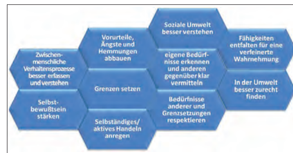
Ziele des Projekts